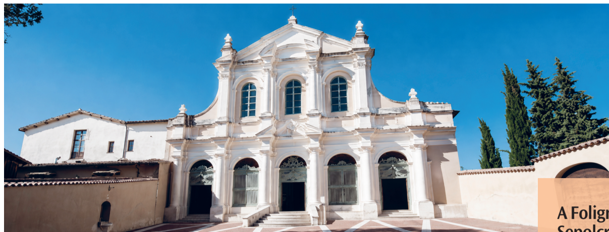
Qui accanto, la chiesa di San Bartolomeo a Foligno, sede dell'Associazione Santo Sepolcro. A sinistra, la riproduzione del Santo Sepolcro di Gerusalemme all'interno della chiesa