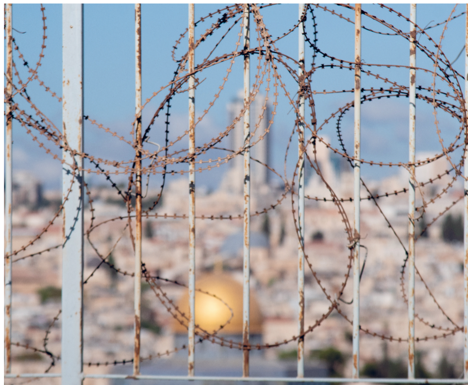
Qui accanto, Gerusalemme tra preghiera e filo spinato. A sinistra, il patriarca Pizzaballa

E cce alcuni brani scelti da “Tornarono a Gerusalemme con grande gioia - Una proposta per vivere la vocazione della Chiesa in Terra Santa”, scritto dal card. Pierbattista Pizzaballa, patriarca di Gerusalemme, e pubblicato di recente.